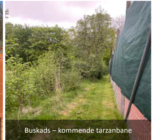
Buskads – kommende tarzanbane