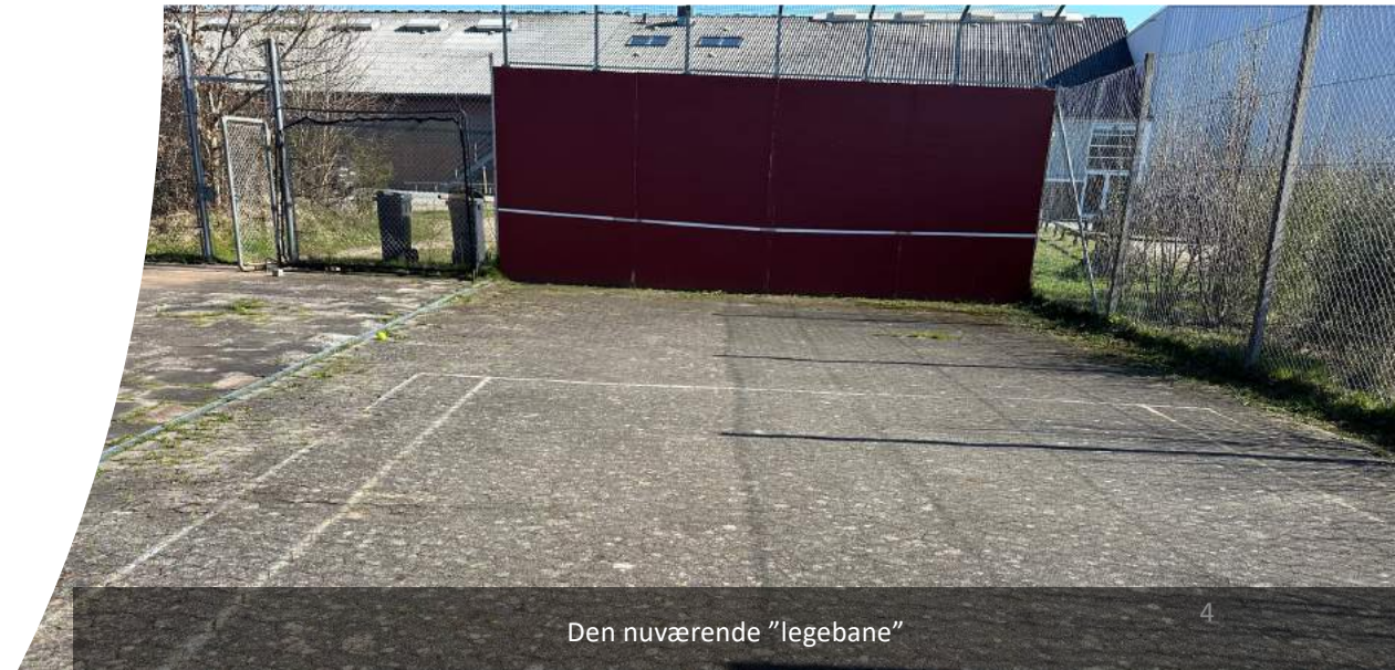
Den nuværende "legebane"