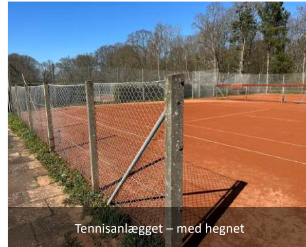
Tennisanlægget – med hegnet